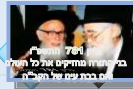
781 תשס"ו בית החרוץ מחזיקים את כל השנה יום ברכת נשם של חסידים

מלך המלכות ד"ר חיים זעירא ר"מ מוסדות חינוך הרצליה