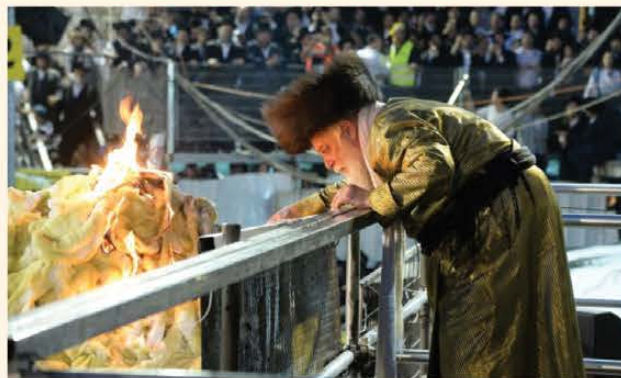
כ"ק האדמו"ר מתולדות אהרן במירון

משה קפא על מקומו, מביט בתדהמה. אך הפעם – העיניים שנשאו אליו מבט לא היו קשות ומתריסות, אלא חמות וזוהרות, מלוות בחיוך עדין.